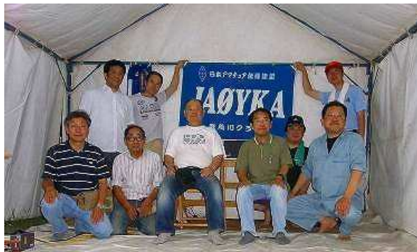
納涼会が始まる頃には13名になりました

糸魚川おまんた祭り、帆船の日本丸が姫川港に寄港して、参加人数を心配しましたが、今年は13名の皆さんが集まってくれました。