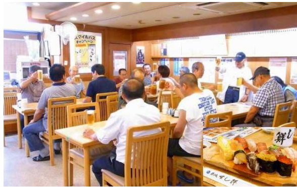
朝から上握り寿司と生ビールで乾杯!

29人乗りのマイクロバスに乗り19時に糸魚川を出発。上信越道、関越道、外環道を乗り継ぎ、夜中に武蔵野健康ランド着。入浴をして就寝。