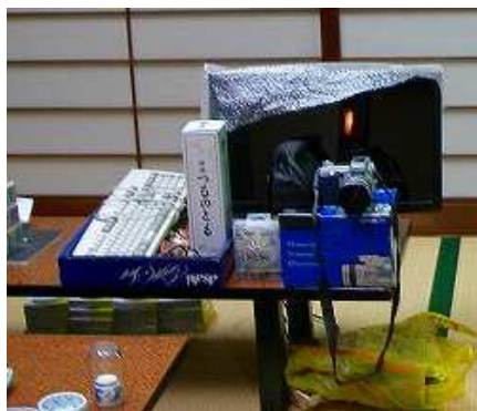
昨年、出品のモニター・デジカメ

例年同様、オークションを行います。無線・パソコン関係、家庭で不用になった品(非食料品)などお持ちより下さい。昨年はデジカメ、無線機などが出品され、大変な盛り上がりでした。参加の申し込みは古川事務局 JEOJJRさん