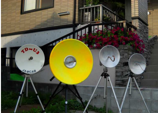
左から5.7GHz, 10GHz, 24GHz, 47GHzのANT

5.7GHzのFMテレビを始めたのが平成に入つてです。しかし、パラボラはなかなか市販品がなく台所のフライパンに取り付け穴をあけたらXYLが