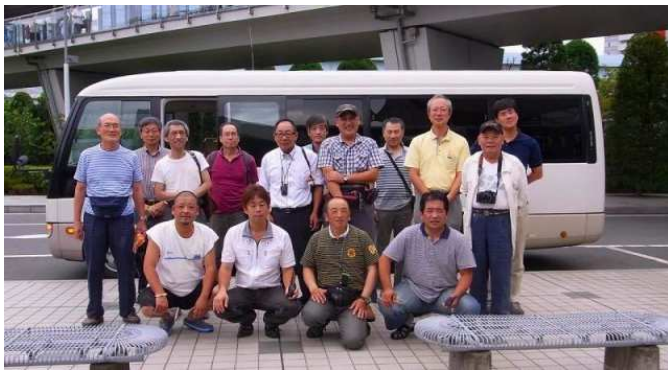
今回の参加者、16名です。

参加された皆様、運転してくださった皆さん大変お疲れ様でした。また、来年行きましょう。