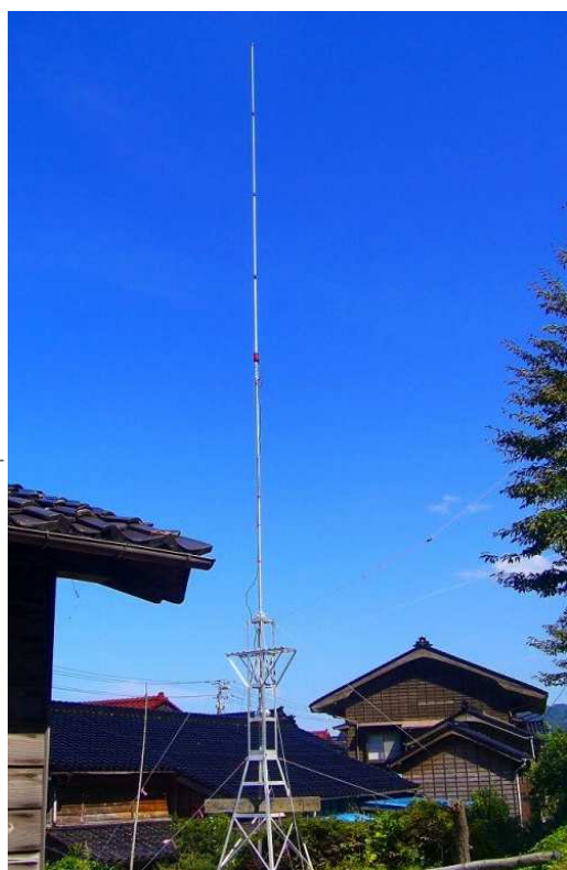
JHOEQA 財さんのイタリア製バーチカル

9月の初めに、ルーフタワーがやってきました。近くで見れば3.8mは大きく感じます。屋根に設置したいのですが冬場の風を考慮して裏の高台に建てる事にしました。