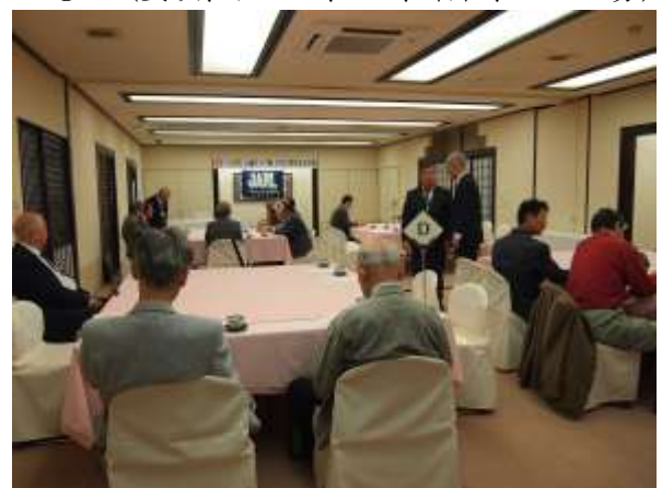
会場の様子 (6～7人掛けの4テーブル)