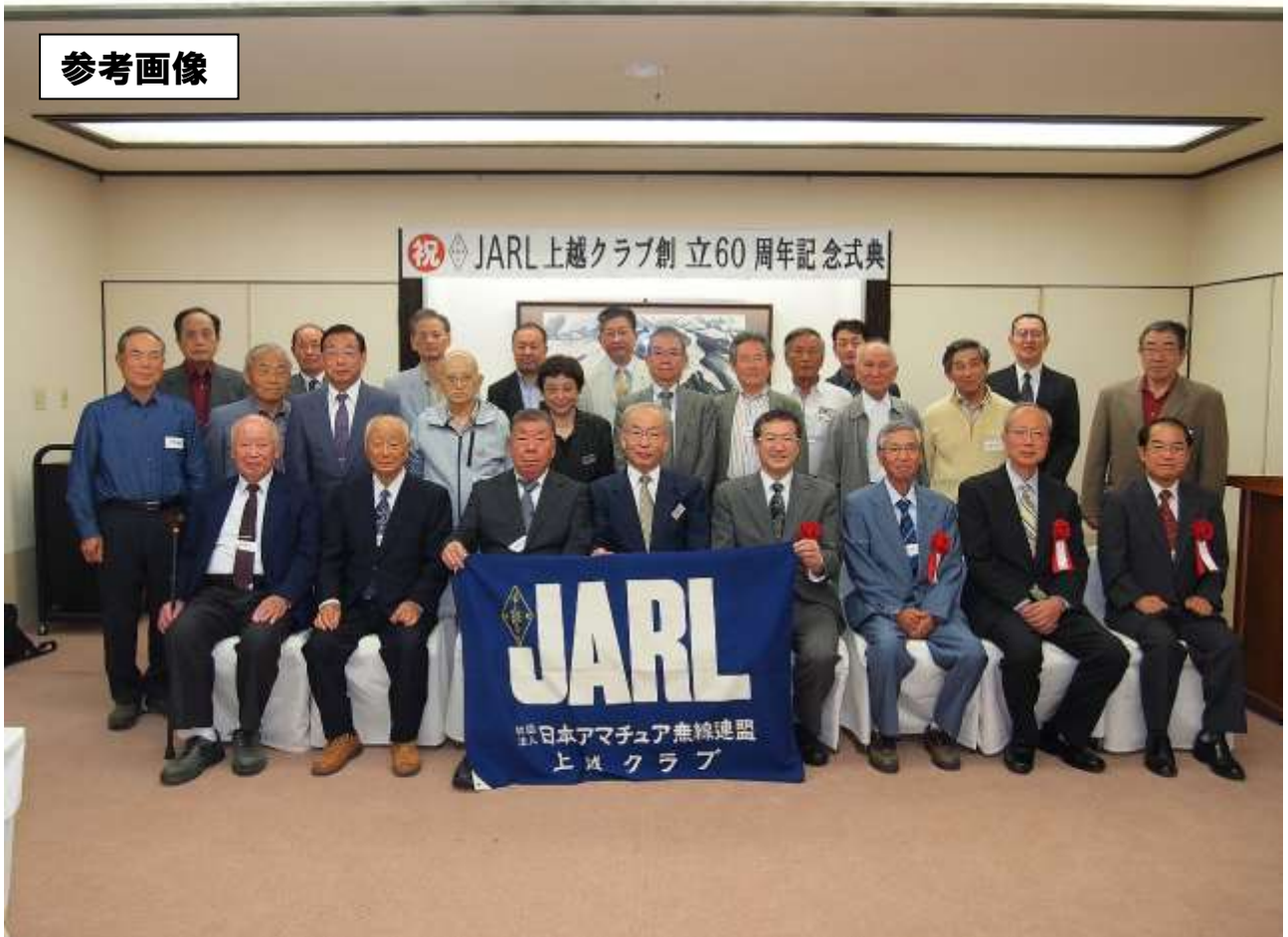
上越クラブ 60 周年記念式典・参加者 26 人