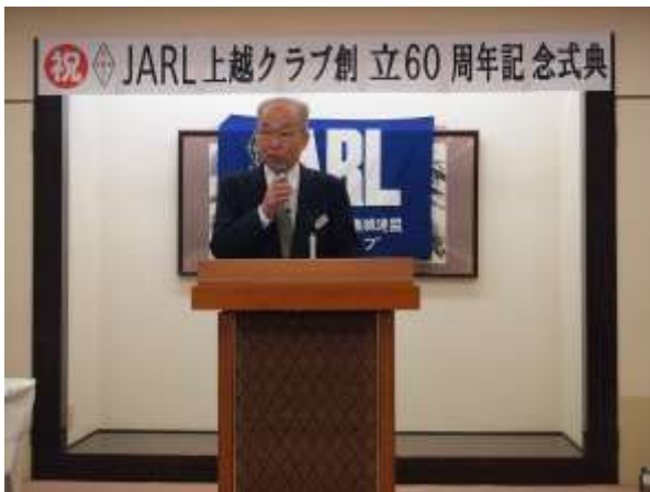
演台の様子 (会長あいさつ)