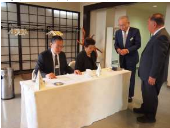
受付の様子 (名簿チェックと会費支払い)