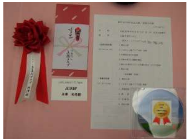
机の上にあったもの (要項、リボン、DVD、名札、ビール券)